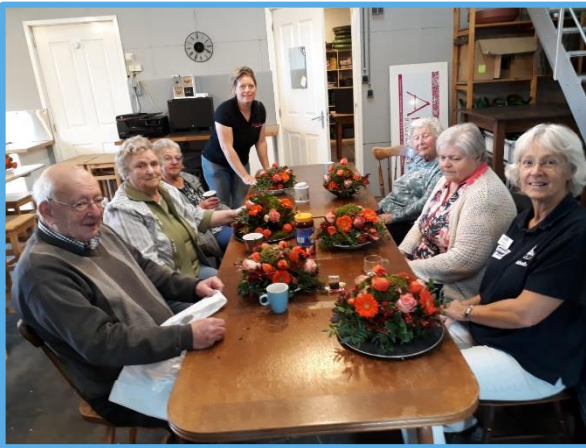
Herfststukje maken bij Artinez op 28-10-2018