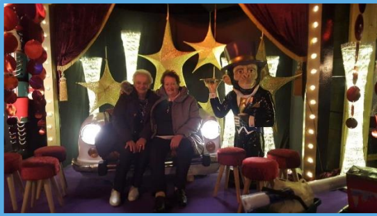
Bij Tuincentrum Avri op 29-11-2018