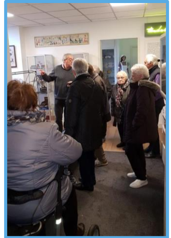
Bij het doktersmuseum tijdens een verrassingsrit in november 2018